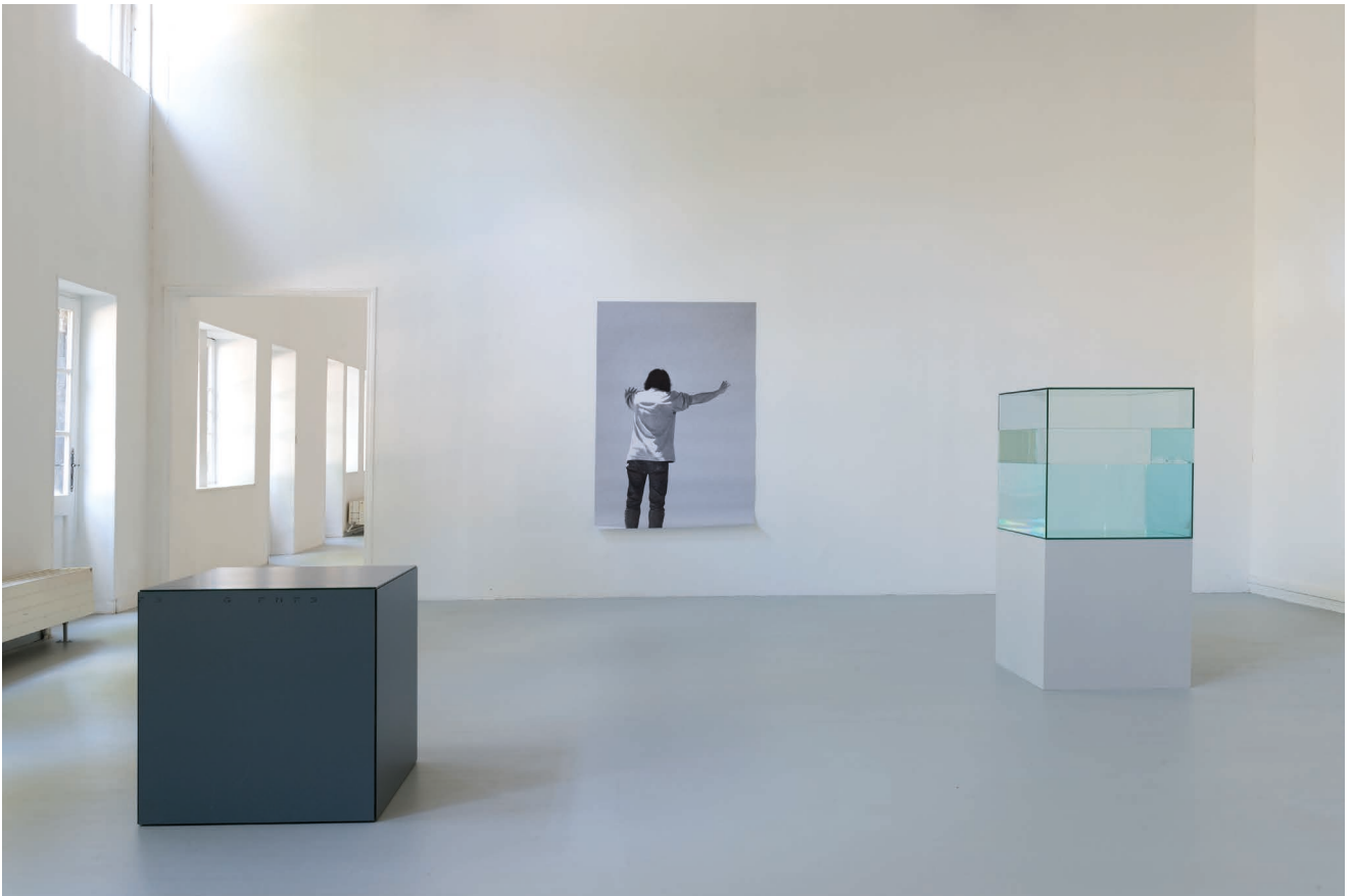
Vue de l'exposition Naissances latentes , Ann Veronica Janssens, à l'Aître Saint-Maclou, 2017 © Marc Damage