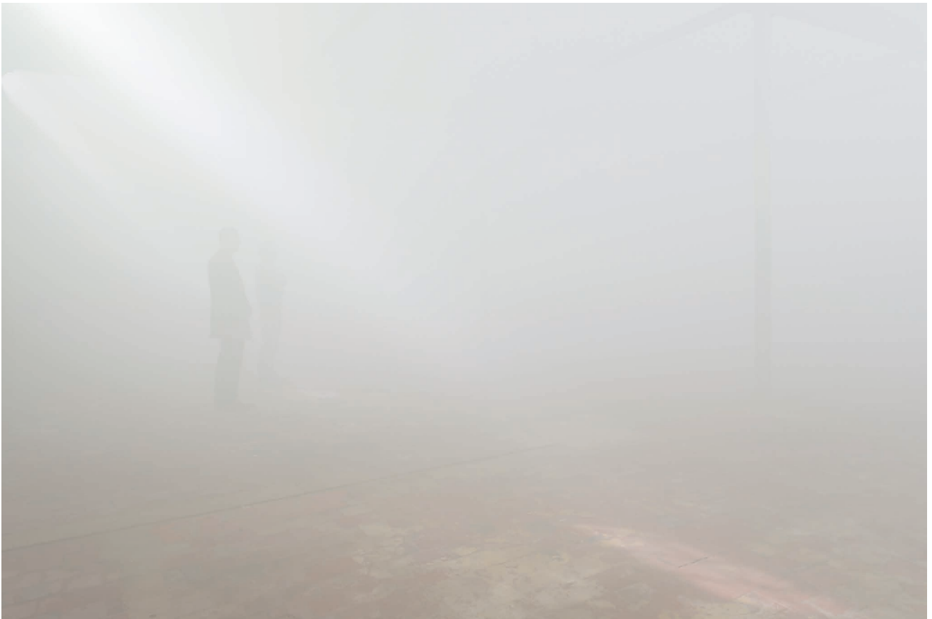
Ann Veronica Janssens, Pearly Haze , 2017 Vue de l'exposition Naissances latentes , Ann Veronica Janssens, au SHED, 2017