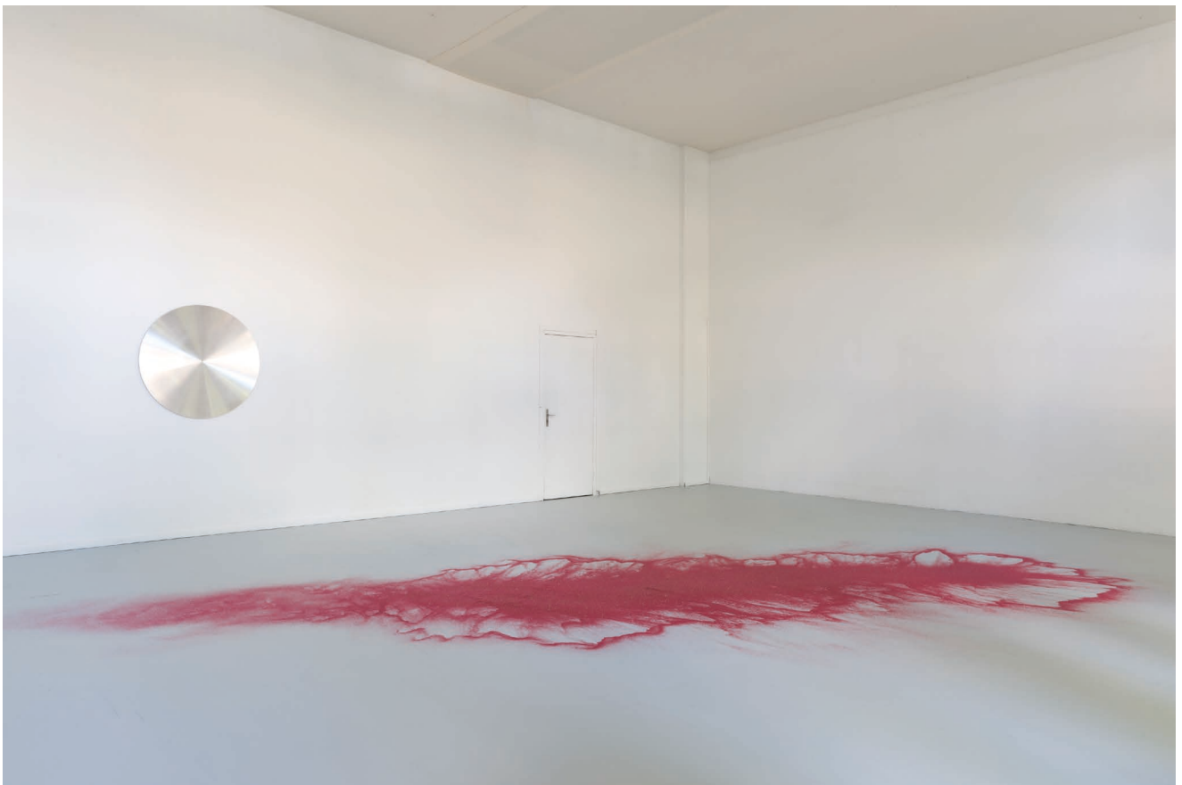
Vue de l'exposition Naissances latentes , Ann Veronica Janssens, à l'Aître Saint-Maclou, 2017 © Marc Damage.