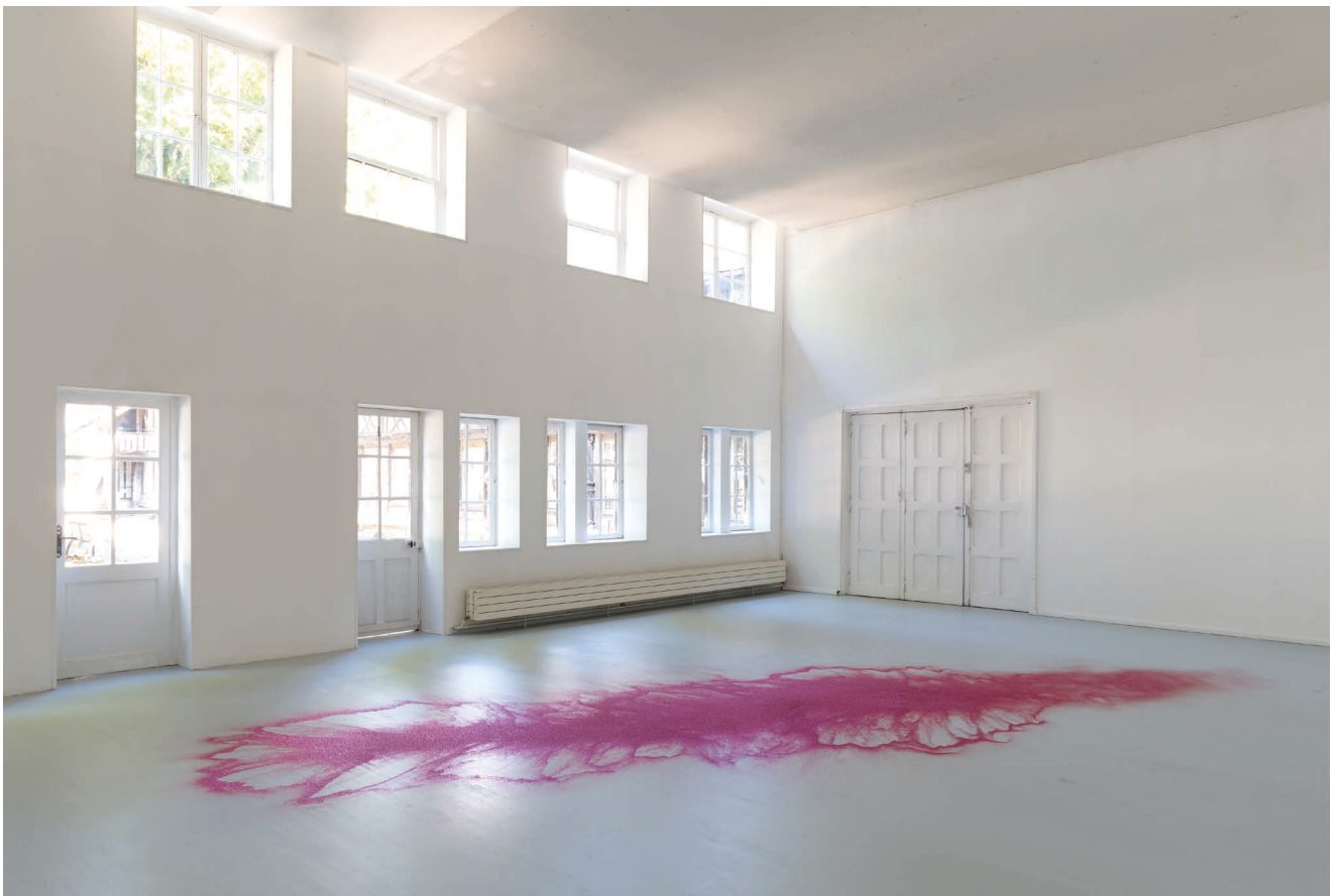
Ann Veronica Janssens, Red Glitter , 2017