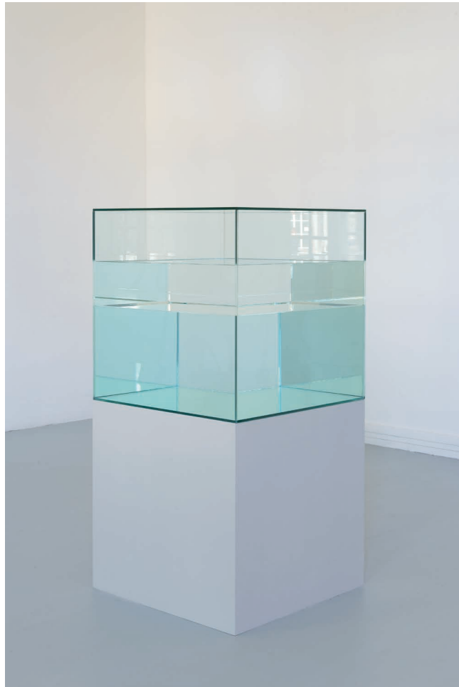
Ann Veronica Janssens, Cocktail Sculpture , 2008 © Marc Domage. Courtesy de l'artiste et de la galerie Kamel Mennour, Paris