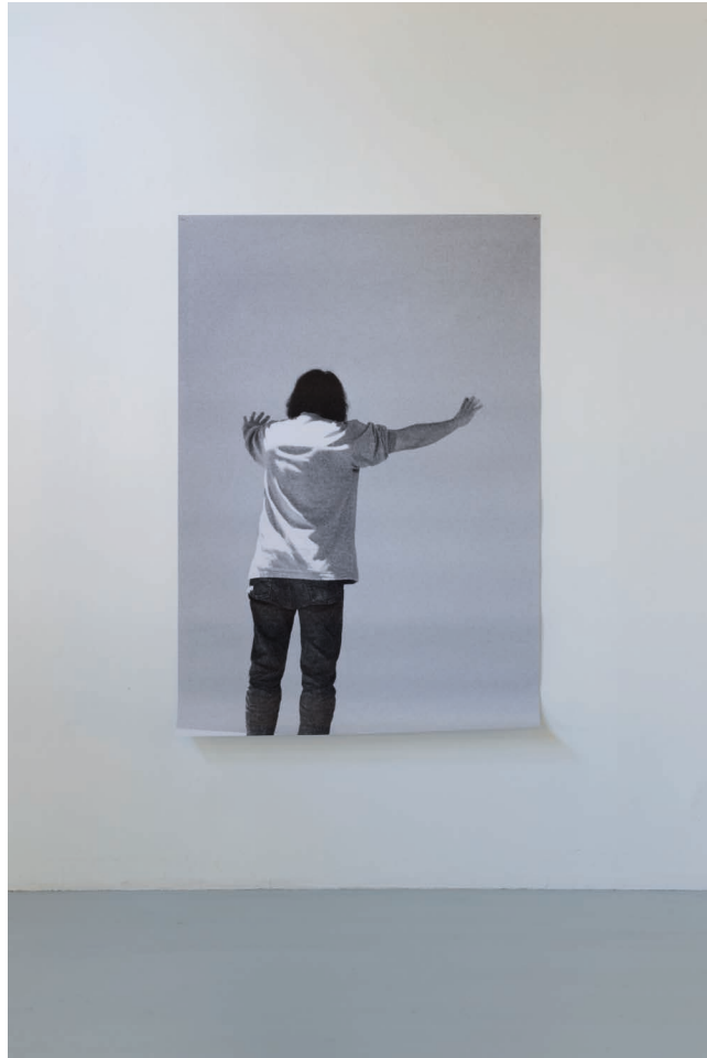
Ann Veronica Janssens, Claudio , 2002