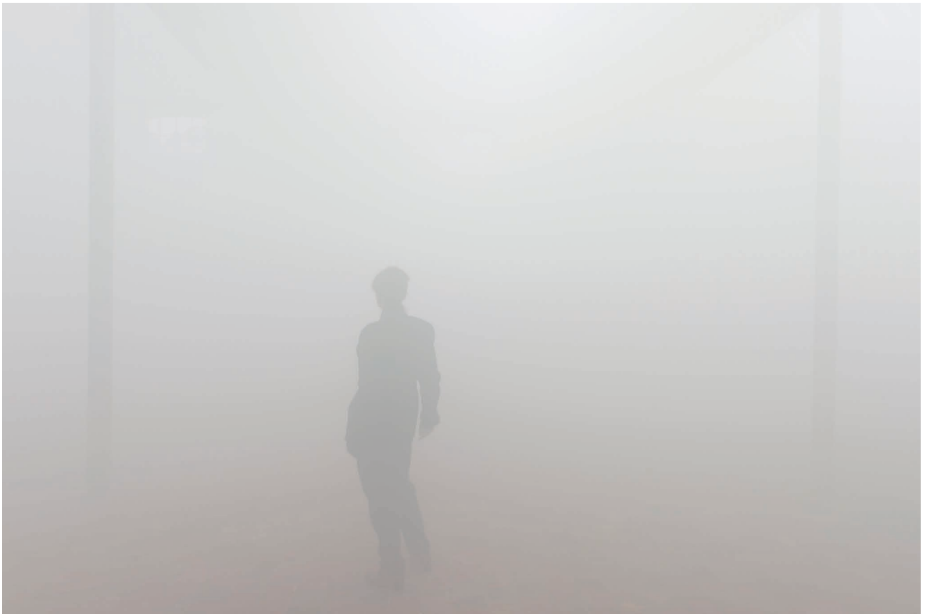
Ann Veronica Janssens, Pearly Haze , 2017 Vue de l'exposition Naissances latentes , Ann Veronica Janssens, au SHED, 2017 © Marc Damage. Courtesy de l'artiste et de la galerie Kamel Mennour, Paris