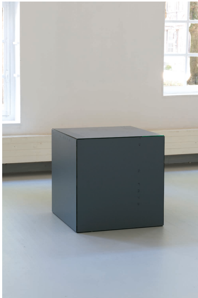
Ann Veronica Janssens, Absence d'infini , 1991 © Marc Damage. Collection Frac Pays-de-Loire