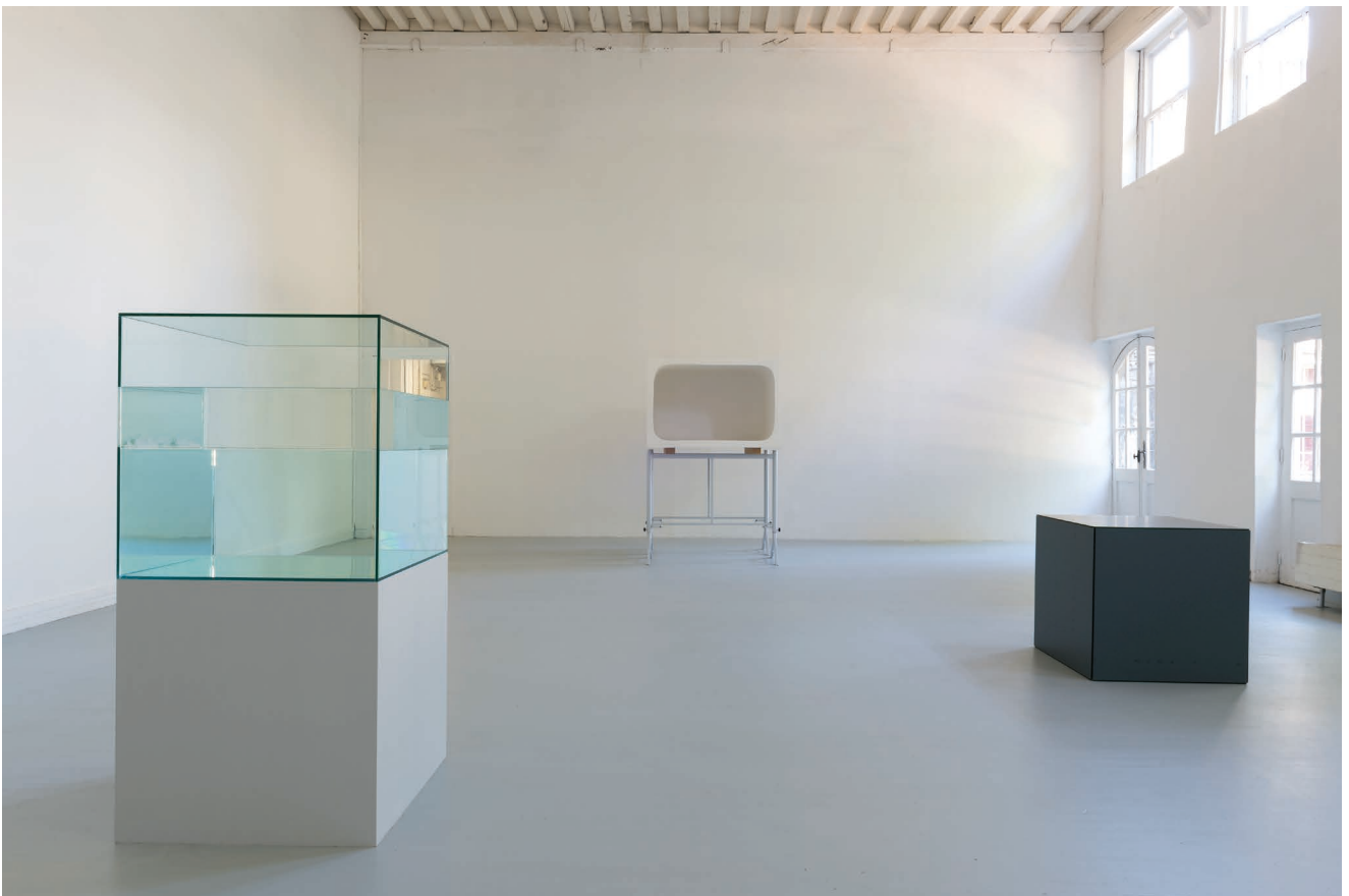
Vue de l'exposition Naissances latentes , Ann Veronica Janssens, à l'Aître Saint-Maclou, 2017 © Marc Damage.