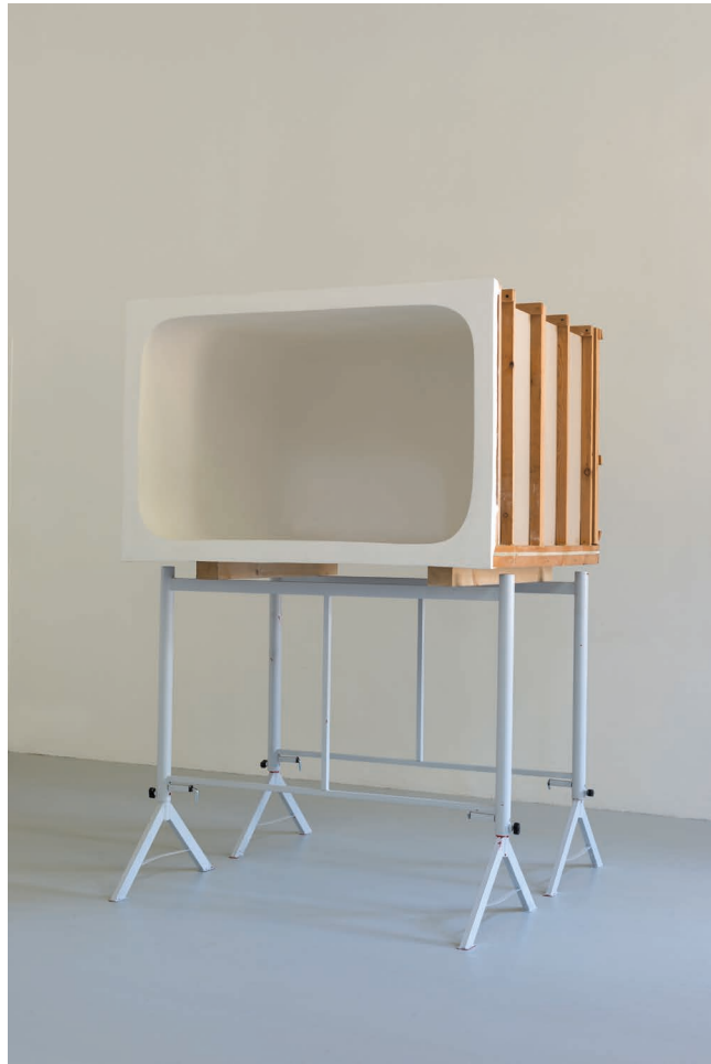
Ann Veronica Janssens, Espace infini , 1999