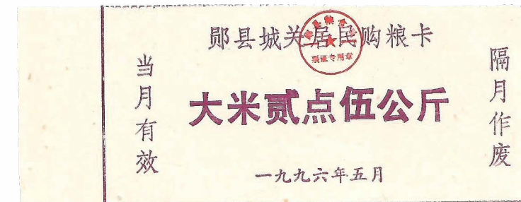
« Rice coupon », ticket de rationnement national en République populaire de Chine, Chine (s.d.)