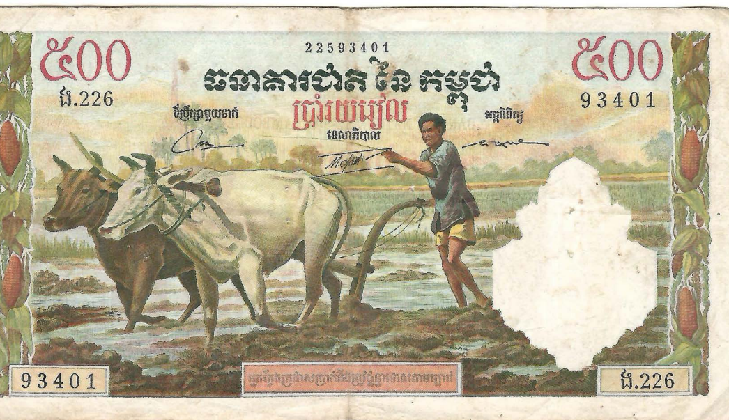
Billet de banque « le travail dans la rizière », Cambodge (s.d.)

Ce positionnement ambitieux de mettre en œuvre une forme d'utopie de proximité en ancrant concrètement le projet éditorial et les rencontres qu'il provoque dans des initiatives locales et à échelle humaine, la revue Rice is nice fait ainsi le pari d'un faire ensemble militant, fondamental pour ses fondateur·ices. La spécificité de son fonctionnement et de son engagement sur un territoire permet notamment d'intégrer au sommaire des personnes parfois éloignées de la poésie et de l'art et/ou en situation d'insécurité linguistique.