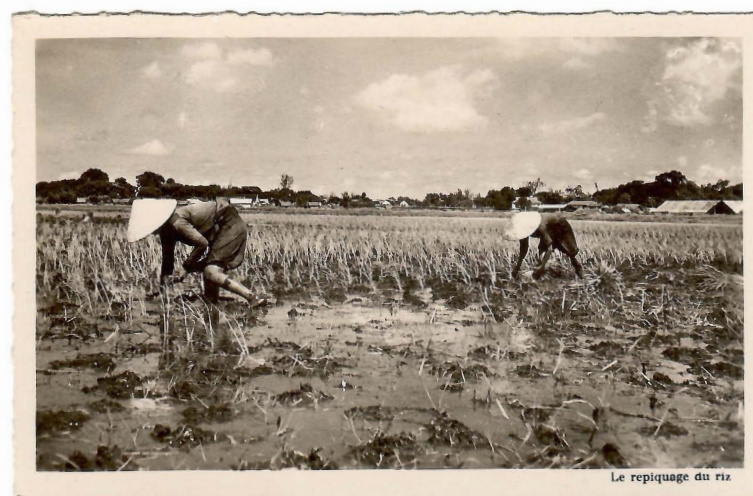
Carte postale « le repiquage du riz », Vietnam (s.d.)

Une iconographie riche, comprenant notamment des documents d'archives liés à l'histoire du riz, mis en relation de manière critique avec les contenus de la revue.